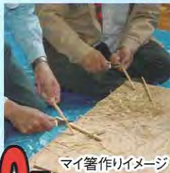
マイ箸作りイメージ

集合場所・集合時間 横浜駅(7:30)~新横浜駅(8:00)~町田駅(9:00)