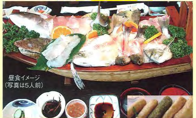
昼食イメージ (写真は5人前)