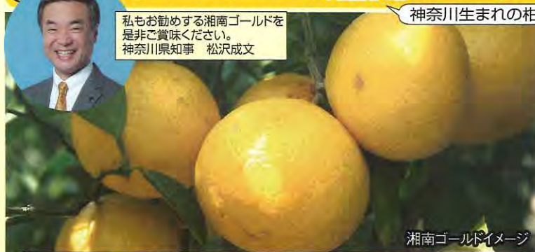
湘南ゴールドイメージ

湘南ゴールドとは・・・みかんよりは小振りですがで華やかな香りと豊かな甘みが特徴の神奈川生まれの柑橘。市場では購入が非常に困難なため「幻のみかん」とも言われています。